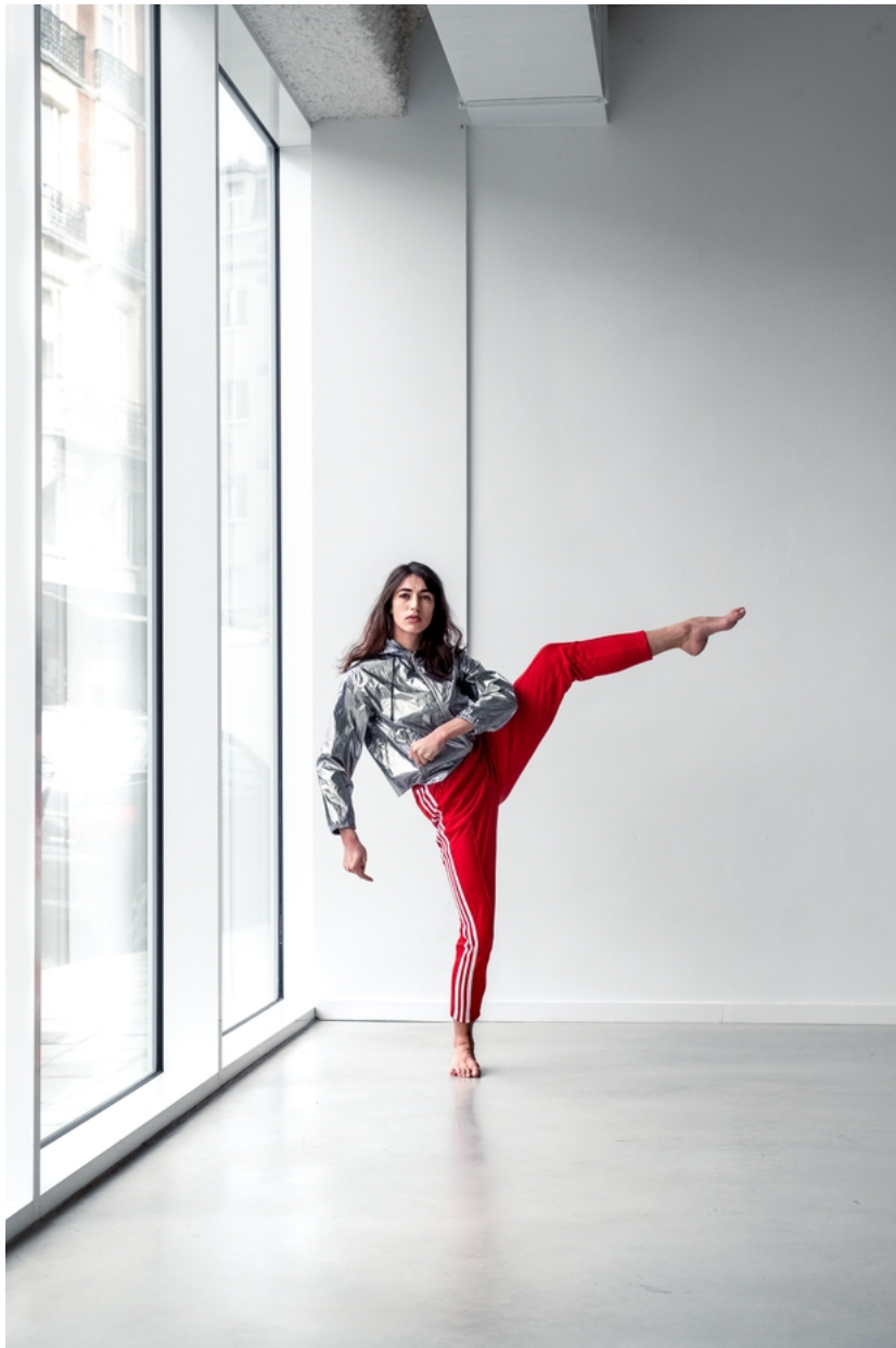
Pour "Stretch", Isabella Soupart a aussi travaillé les images en faisant appel au photographe de scènes Danny Willems.

Dédié à la mode et au design, ce lieu central de la capitale offre un écrin brut, une luminosité singulière à Stretch , création qu'Isabella Soupart veut "inscrire le plus possible dans une réalité du temps" – avec ses nuances de lumière notamment, du jour encore clair à 18 heures, au début de la performance, jusqu'à l'entrée dans la nuit.